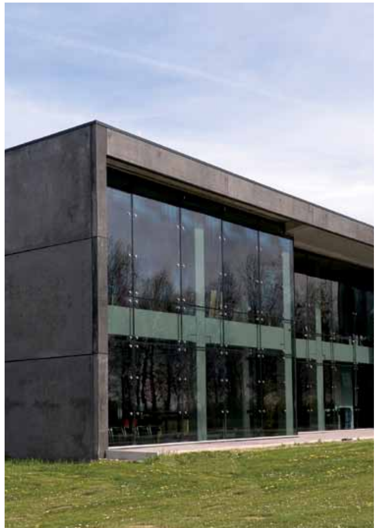
■ Door vrijwel het hele gebouw heen wordt gebruik gemaakt van led-verlichting.