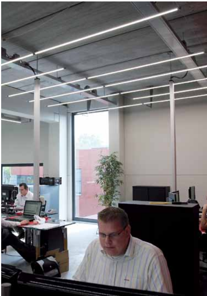
■ De led-verlichting wordt centraal gestuurd.